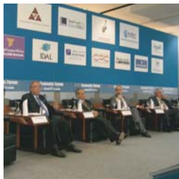
المنتدى الاقتصادي العربي في ٤ و ٥ أيار، ٢٠٠٧