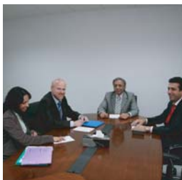
مدير برنامج الإستثمار في OECD زار "ايدال"