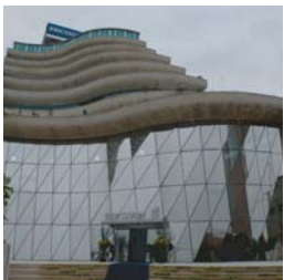
اريكسون - آب ٢٠٠٧